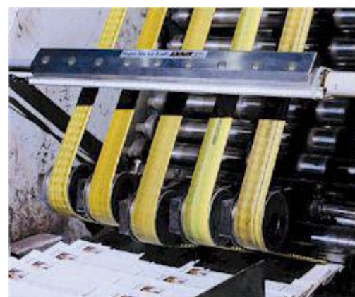
Модель 111118 длиной 18" (457мм) Супер Ионного Воздушного Ножа превращает забивание в приемнике.

Потребление воздуха и шум минимальны, а напор можно регулировать от "порыва" до "бриза". Тесты показывают, что два ионизатора, установленные на расстоянии 2 фута (610 мм) от заряженной поверхности, также эффективны, как и ионизирующая планка, установленная на расстоянии пол дюйма (13 мм) от поверхности.