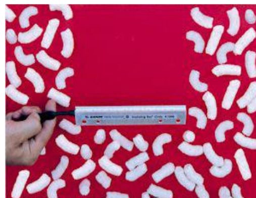
Модель 7006 длиной 6" (152мм) Ионизирующей Планки удаляет статический заряд с упаковки для арахиса, предотвращая её слипание.

Ионизирующая Точка эффективна при локальной нейтрализации. Имея небольшой размер, она идеально подходит для перематки или резки. Ее также можно установить в трубе для нейтрализации заряда, возникающего при движении воздуха или деталей.