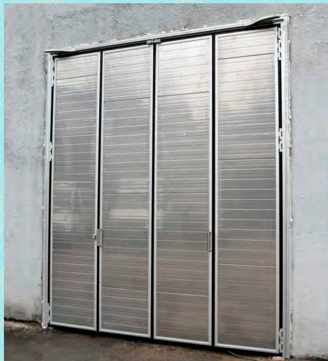
4-х секционные ворота

Система доводчиков обеспечивает легкое открывание двери. Требуется минимальное усилие.